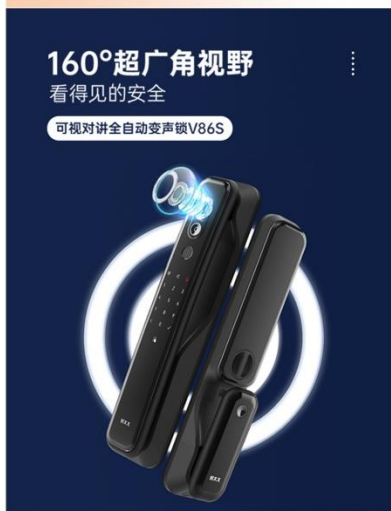
160° 超广角视野，看得见的安全 远程视频对讲，时刻关注家中状态