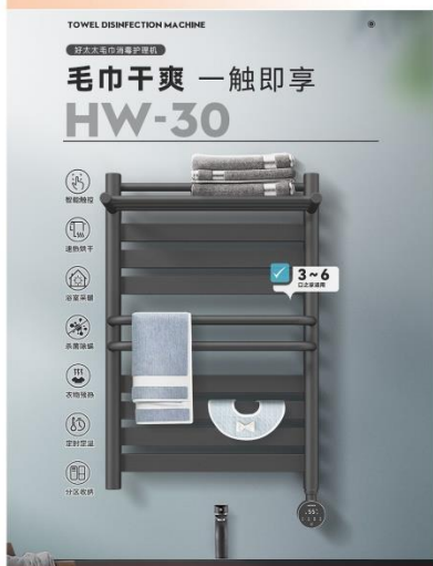
集烘干、浴霸、衣物预热、置物、毛巾架五大功能于一体的毛巾护理机，实用且强大。