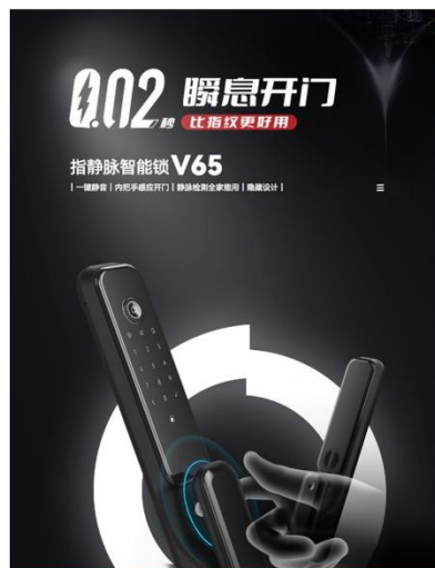
0.02S瞬息开门，比指纹更好用 隐藏指静脉识别，美观更快捷