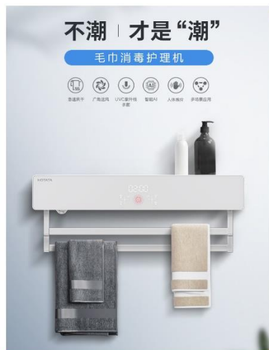
集烘干、消毒、除湿为一体的毛巾专业护理，多场景全天候适用。