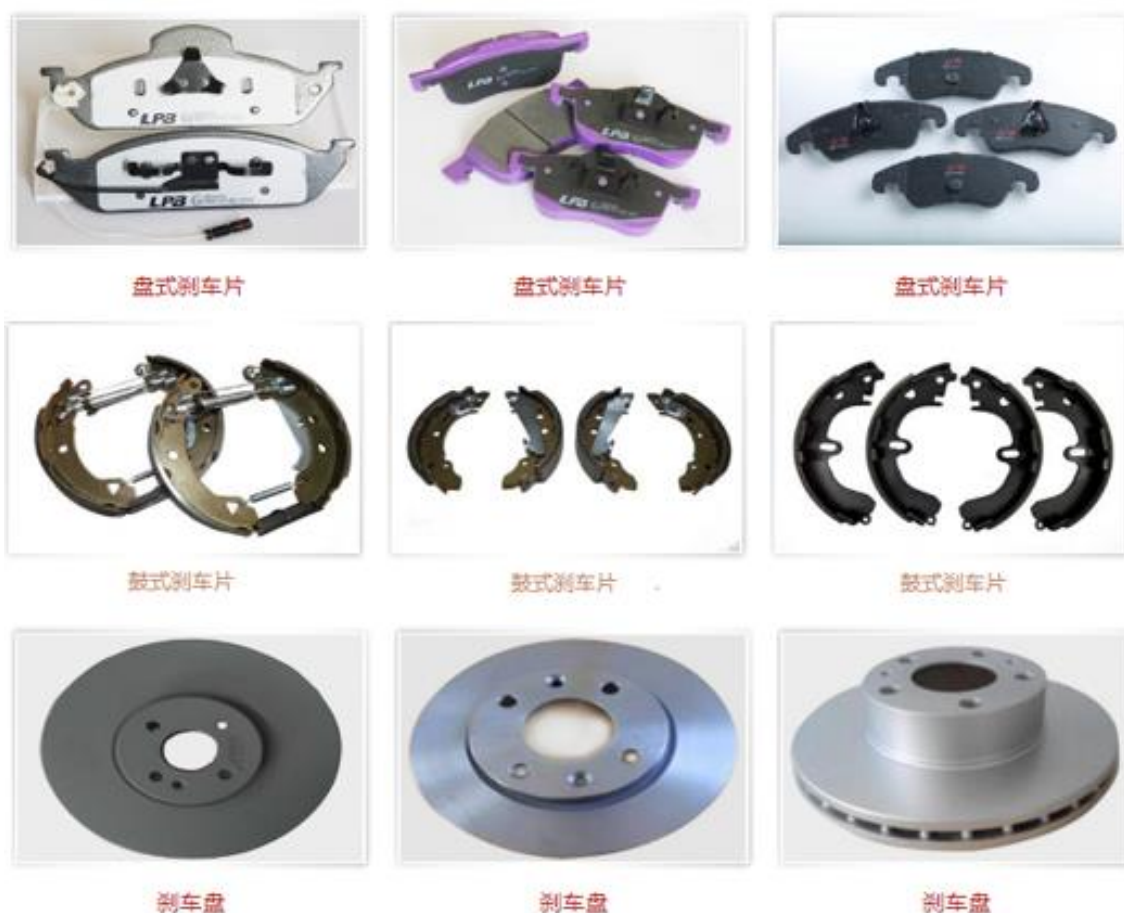
图 3-1 乘用车盘式刹车片、鼓式刹车片&刹车盘

目前公司拥有 260 多个制动摩擦材料配方，可生产 6,600 多种汽车刹车片产品、4,400 多种汽车刹车盘产品，适用于全球主流乘用车车型和商用车车型。公司产品目前主要面向国外市场，并以国外 AM 市场的销售业务为主、国内 AM 市场的销售业务为辅，同时注重 OEM 市场，公司已为戴姆勒等部分汽车生产商提供原装配套产品。