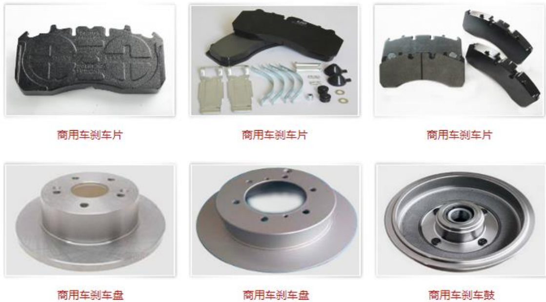
图 3-2 商用车刹车片&amp;刹车盘