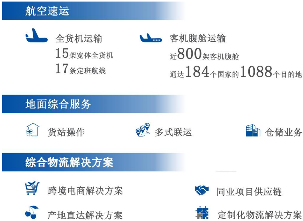
图 1. 公司主营业务图示