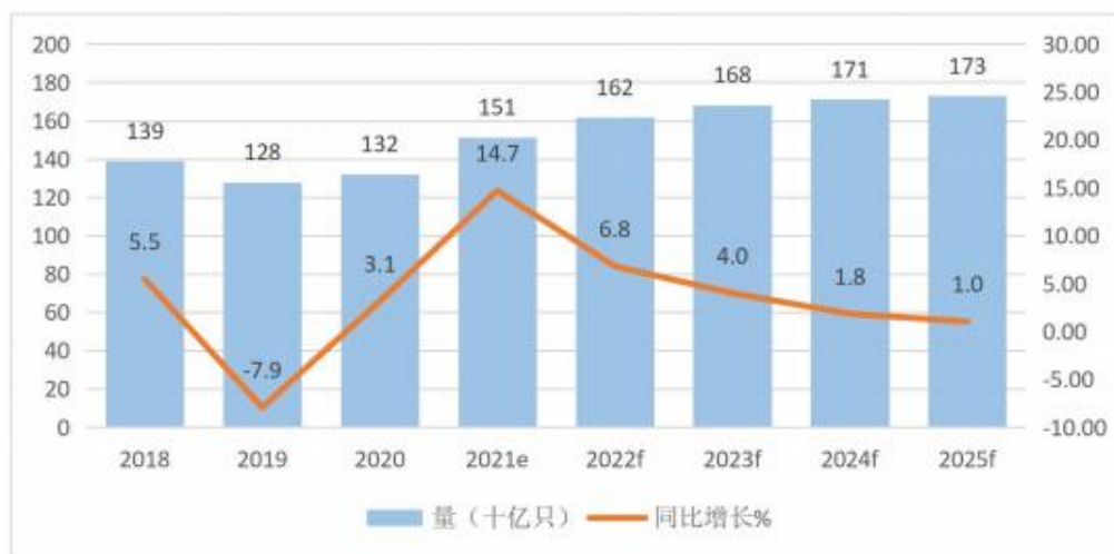
2018 年-2025 年全球铝电解电容器市场需求量发展与预测

根据中国电子元件行业协会信息中心的数据：预计 2022 年全球铝电解电容器需求量约为 1,620 亿只，同比增长 6.8%，到 2025 年将达 1,730 亿只，2020-2025 年五年平均增长率约为 5.6%。