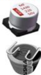
贴片式铝电解电容