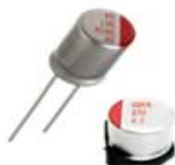
高分子固态铝电解电容 引线式、贴片式