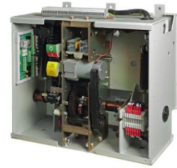
中压断路器操作机构