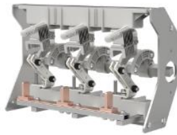
环网柜负荷开关单元开关