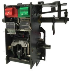
低压断路器操作机构