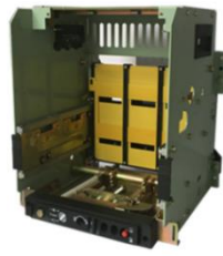
低压断路器框（抽）架