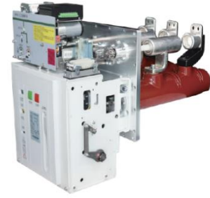
中压 C-GIS 专用真空断路器