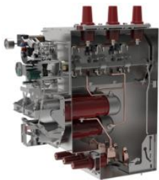
环网柜组合电器单元气箱