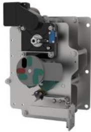
环网柜负荷开关单元操作机构