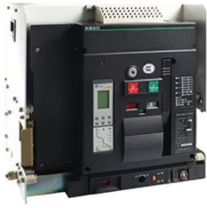
低压智能型万能式断路器