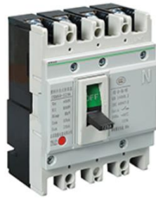
低压塑料外壳式断路器