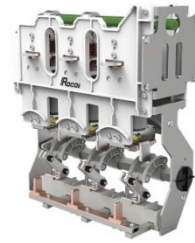
环网柜断路器单元开关