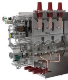
环网柜断路器单元气箱