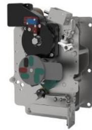
环网柜组合电器单元操作机构