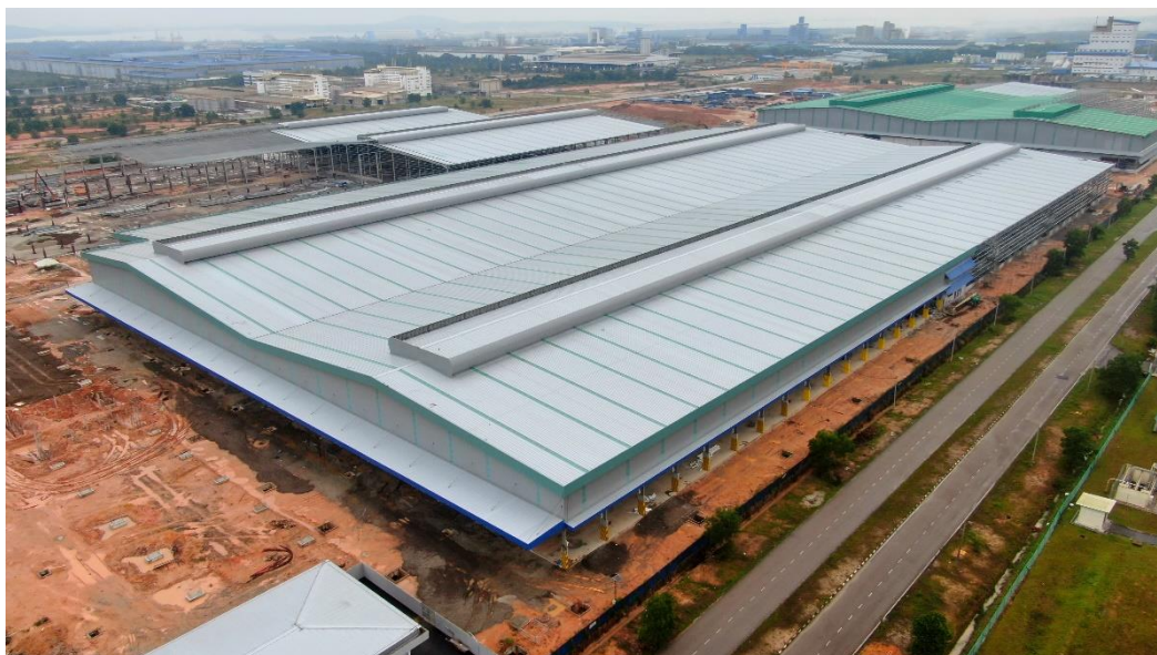
130万吨扩建项目现场图（图一）

报告期内，为了应对市场需求及缓解马来西亚生产压力，公司重点推进了马来西亚年产130万吨铝合金锭项目。该项目按计划有序的推进，已完成了部分土建工程，相关配套的生产设备也陆续到位，采购、生产、销售人员的配备和培训工作也按既定计划有条不紊的进行中，预计2023年下半年即可完成全部的基础建设和第一期65万吨产能的逐步释放。同时公司根据扩产进度提前开展生产体系人才培养计划，为后续新制造基地储备人才梯队，为可持续发展打下坚实的管理基础。