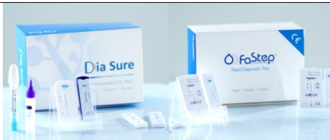
心肌、肿瘤检测系列