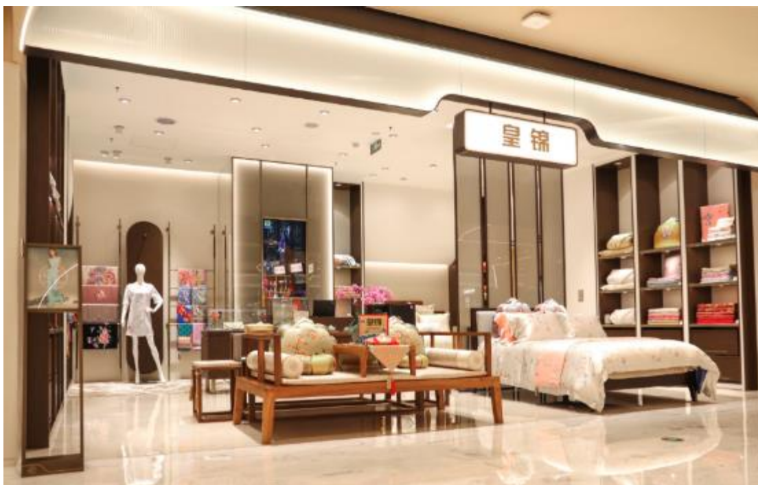
皇锦 | 新店铺形象