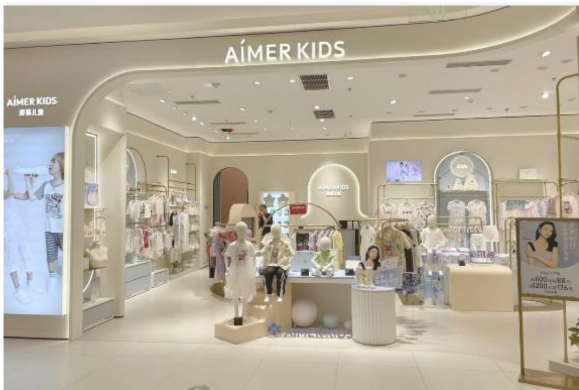
AIMER KIDS | 新店铺形象