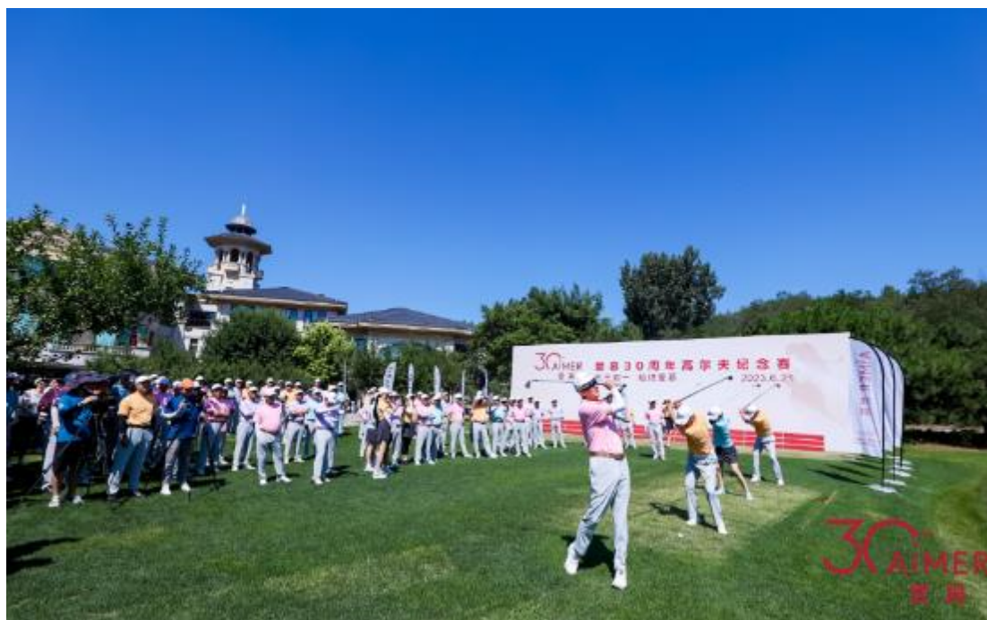
爱慕 30 周年高尔夫纪念赛