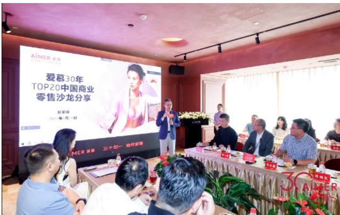
爱慕 30 年 TOP20 中国商业零售沙龙