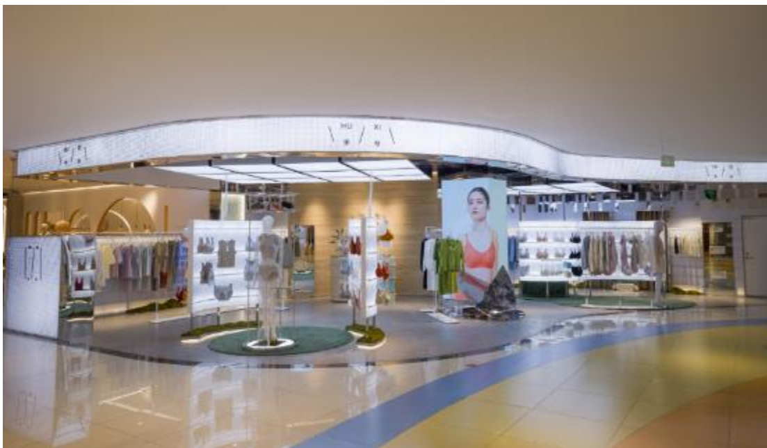
乎兮 | 兰州首家线下门店开业