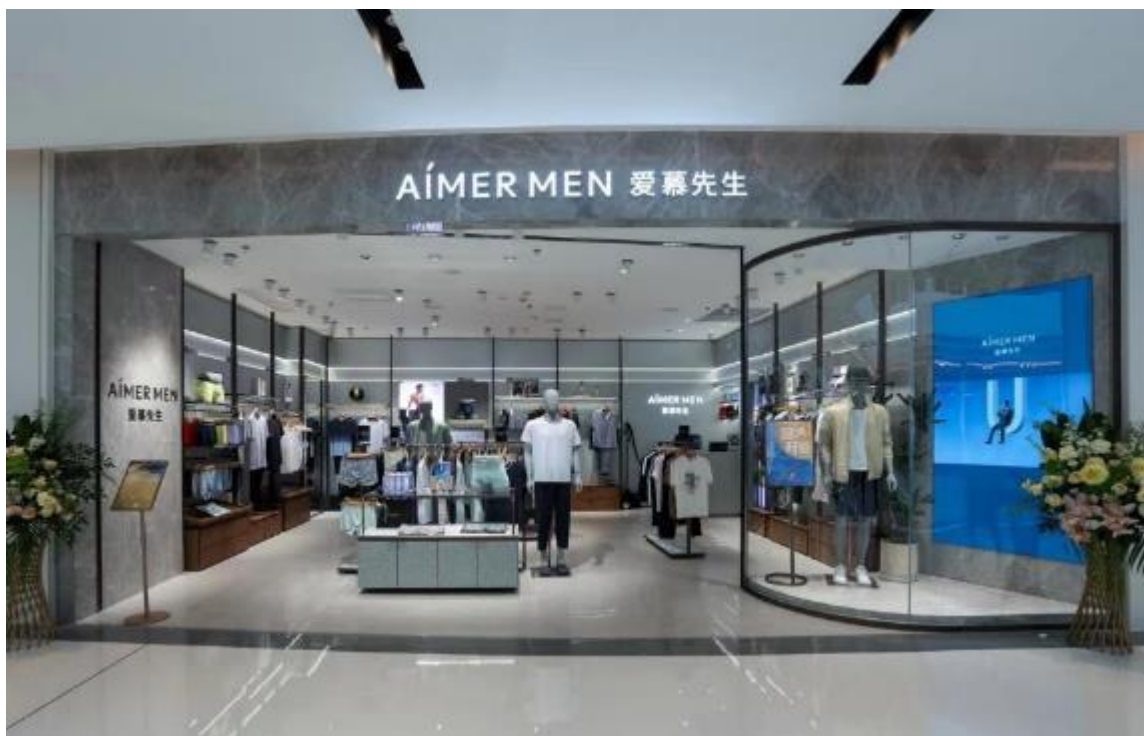
AIMER MEN | 新店铺形象