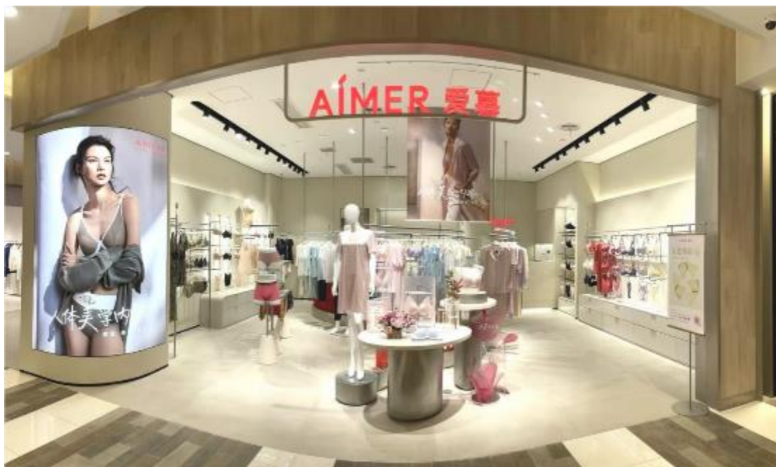
AIMER | 新店铺形象