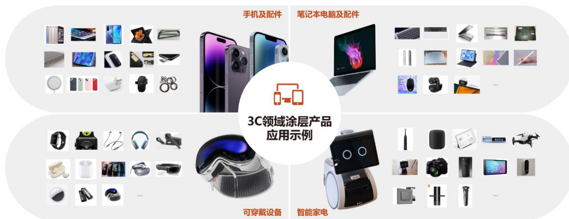
△3C 高端消费类电子涂层产品与解决方案部分应用示例图