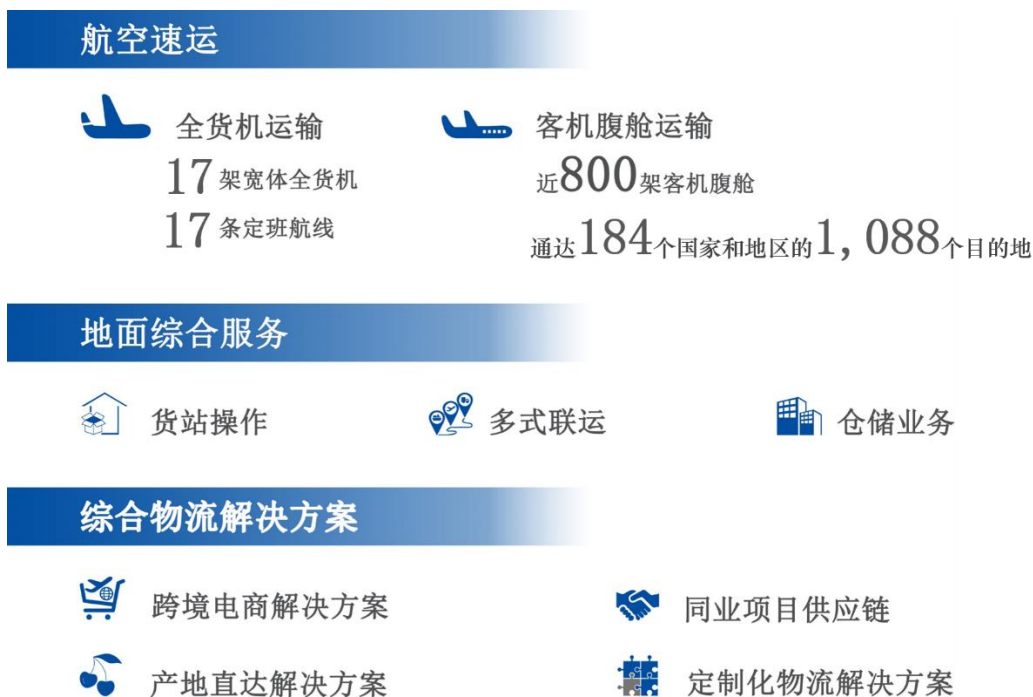
图 2. 公司主营业务图示