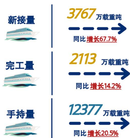
图 1. 2023 年上半年中国船舶行业统计数据

上半年克拉克森海运指数平均值同比下滑 38%至 24119 美元/天，和“能源类”商品运输有关的细分市场表现更佳，而集装箱船和干散货船收益持续回落。虽然国际航运市场同比有所回落，但国内造船市场份额持续扩大，上半年全国造船完工量 2113 万载重吨，同比增长 14.2%；新接订单量和截至 6 月底的手持订单量也大幅增长。报告期内，受益于我国船海产业的良好发展势头，公司船海配套业务新签合同金额同比增长 7.38%，完成工业总产值同比增长 67.20%。