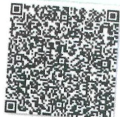
郑珊杉的年检二维码.png