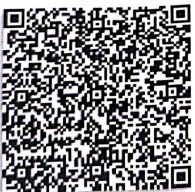
龙娇的年检二维码.png

本证书经检验合格, 继续有效一年。 This certificate is valid for another year after this renewal.