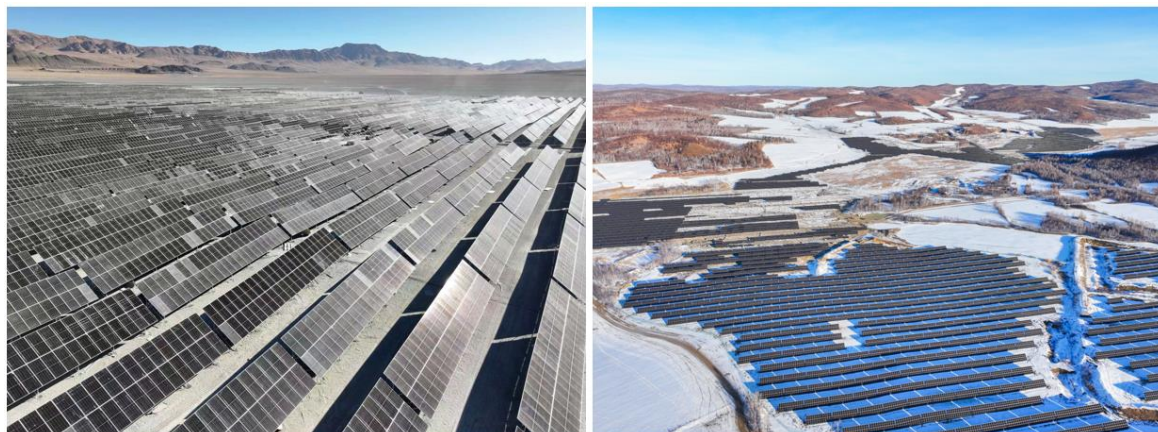
海拔 4700 米西藏拉果错源网荷储一期光伏（左）；黑龙江多宝山铜业一期光伏（右）

一期风光、巴彦淖尔紫金风电、紫金锂元光伏、塞尔维亚一期光伏、圭亚那一期光伏等一批项目预计 2024 年内实现运行发电；同时紧贴紫金矿业在海外和国内的矿山及冶炼项目，还有一批项目正在进行前期布局准备工作。