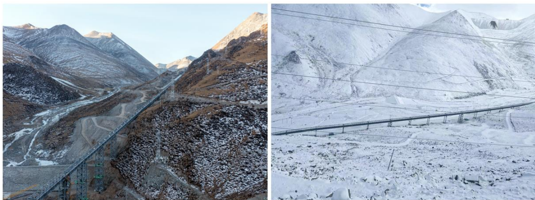
西藏巨龙铜业金属矿第二原矿胶带运输工程带式输送机

公司是全球最大的大气环保装备研发制造商，除尘、脱硫脱硝、电控、环保输送等装备的研发、制造和工程业绩处于行业领军地位，技术总体达到国际先进水平，部分技术国际领先，工程业绩遍布全球 50 多个国家和地区。主要技术及产品包含：各类电除尘器及电袋复合除尘器、干式超净+技术净化装置、湿法脱硫系统、尘硝一体化治理系统、烟气 SCR 及 SNCR 脱硝系统、智能环保散料输送系统、电控装备、脱硝催化剂全产业链、VOCs 治理系统、污泥干化、烟气环保岛智慧系统、垃圾焚烧发电厂烟气二氧化碳捕集技术等，广泛应用于燃煤锅炉、钢铁烧结及球团、焦化炉、玻璃窑、水泥窑、生物质发电、垃圾发电、石油化工催化裂化装置等多种工业炉窑的烟气深度净化和治理，为客户提供工业烟气超低排放一揽子解决方案。