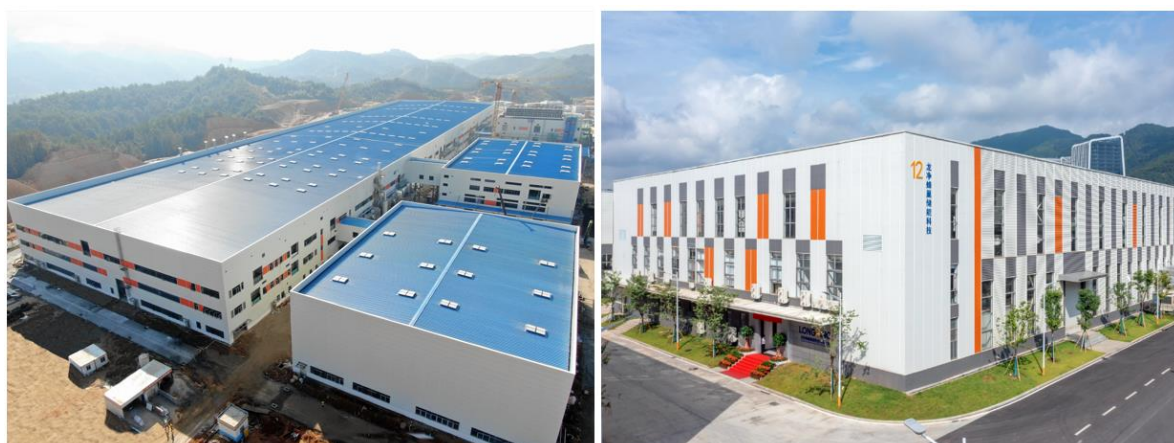
磷酸铁锂储能电芯生产车间（左）；储能电池 PACK 与系统集成车间（右）