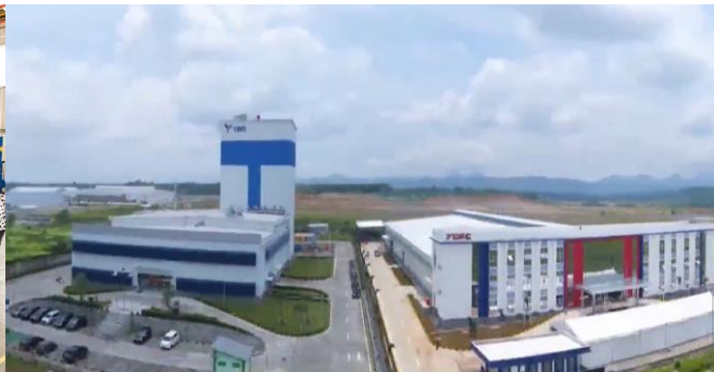
长飞印尼光纤及光缆厂房

在光器件及模块板块，公司子公司博创科技完成了与长芯盛的整合，保持了在国内电信市场的领先优势，并在用于数据中心市场的高速光模块领域不断取得进展。2023 年度，公司光器件及模块分部毛利率为 14.09%。