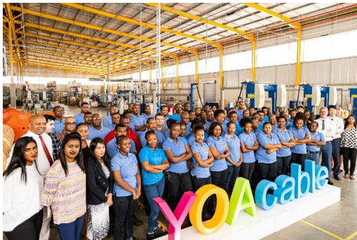
长飞非洲员工及厂房

在光缆板块，公司进一步巩固了国内市场的领先地位，完善了海外产能布局，提升了市场份额及品牌知名度。同时，公司通信网络工程业务也在稳步推进。2023 年度，公司光缆分部毛利率为 17.80%。