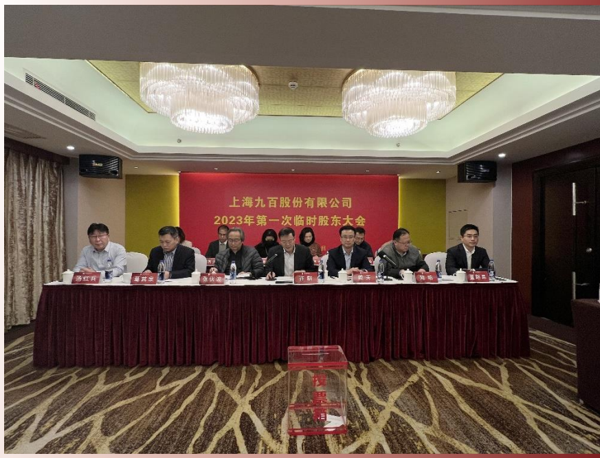
▲ 上海九百股份有限公司 2023年第一次临时股东大会