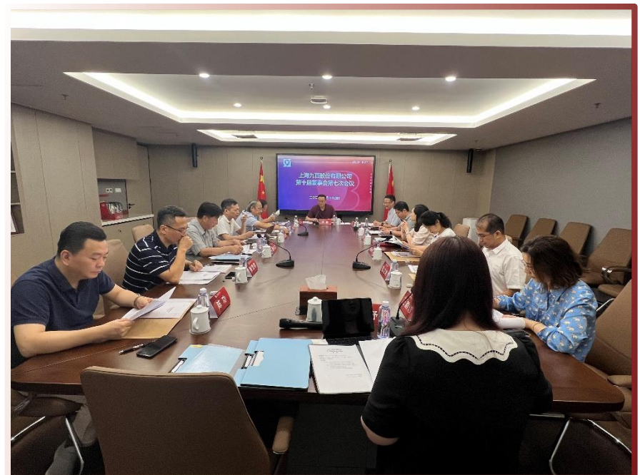
上海九百股份有限公司 ▲ 第十届董事会第七次会议