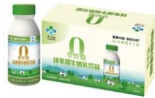
0蔗糖抹茶甜牛奶乳饮品