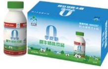
0蔗糖甜牛奶乳饮品