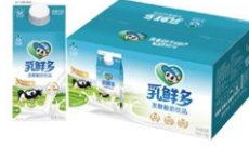
乳鲜多发酵酸奶饮品