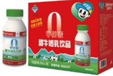
0蔗糖甜牛奶乳饮品