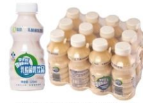
320mL 李子园乳酸菌饮品