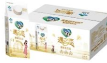
遇之恋酸味乳饮品