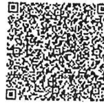
用该码的注册二维码.png