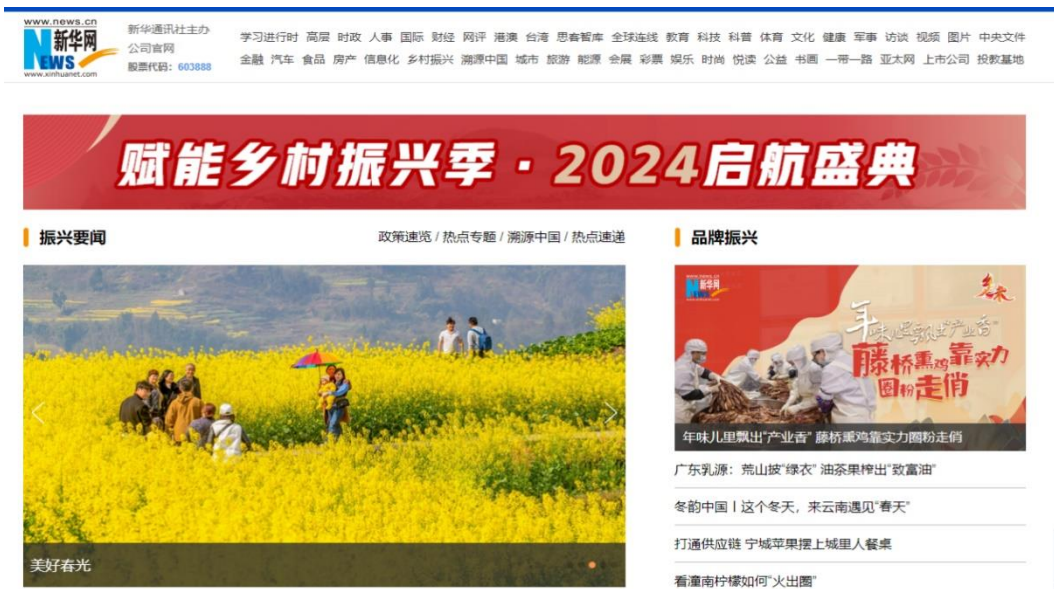
图：“乡村振兴”频道页面截图

5、助力实施乡村振兴战略。推出《乡村振兴在行动 | 产业兴旺活力足——河北新河特色产业发展新图景》《2023 年京津冀动力电池回收利用产业对接活动在新河举办》等重磅报道，大力宣传新河“美丽乡村”新面貌。充分发挥“新华网红”网络“轻骑兵”作用，推出《XuXu 道来 | 新河新气象》体验式报道，有效提高当地知名度、影响力，为帮扶县巩固拓展脱贫攻坚成果、实施乡村振兴战略营造良好内外舆论环境。