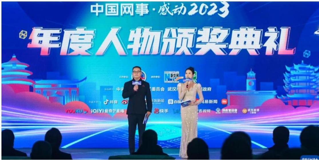
图：“中国网事·感动2023”年度颁奖典礼活动现场现场

3、持续打造“小围裙”计划。继续推出“小围裙”计划第三季。邀请孩子和家长化身“美食博主”，记录小美食家们制作家乡美食的过程，制作短视频参与比赛，同时在长沙开展夏令营活动，得到政府部门、协会组织、学校家庭、演艺明星等积极响应，自启动以来，小围裙计划活动在抖音平台受到广泛关注，话题#小围裙计划#播放量达5.3亿。