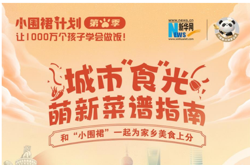
图：“小围裙计划第三季 城市“食”光萌新菜谱指南” 页面截图