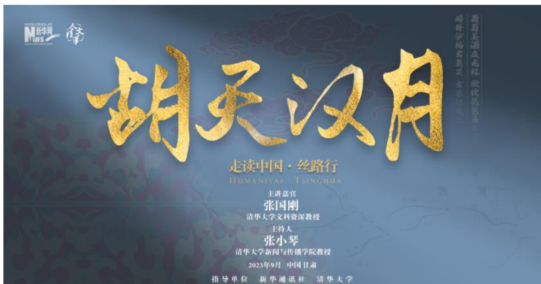
图：《走读中国·丝路行》

1、着力打造新型智库平台。围绕新华社国家高端智库舆情研究中心职能定位，着力打造具有决策影响力、社会影响力和国际影响力的智库研究机构。通过举办思客年会、思客闭门会、思客会等，为政企客户提供高附加值的智库服务，成功策划举办了第五届博鳌亚洲论坛思客会“高水平开放下的中国经济新活力”，受到各方高度评价。联合新华社研究院、中国教育电视台联合推出智库访谈节目《新华智策》第二季；围绕“一带一路”十周年，创新性推出行进式文化探源节目《走读中国·丝路行》，打造IP化、系列化、精品化的直播态文化融媒产品。