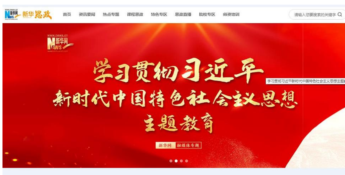
图：“新华思政”页面截图

2、 深入推进新华思政平台建设。 新华思政平台自上线以来已覆盖全国千余所高校。2023年，新华思政上线西南财经大学、井冈山大学等高校课程直播，累计浏览量超三千万。2022年推出的“新华英才”大学生就业服务云平台，2023年新华英才就业平台播发线上活动3场，总浏览量超千万。