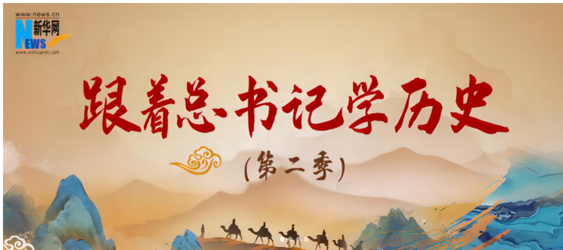
图：《跟着总书记学历史（第二季）》页面截图

2、守正创新做好重大主题报道。圆满完成全国两会、杭州亚运会、成都大运会等重大主题报道。35次受权承担重大网络直播任务，其中22次担纲网上唯一文字出口，充分彰显新华网的权威优势、政治优势。推出的《新华访谈 | 与杭州亚运会开幕式总导演陆川一起聊聊亚运会》受到网民广泛欢迎点赞。《功成》等一批兼具“网感”和“科技感”的融媒报道精品在网上不断产生刷屏效应。推出《以“理”服人：高质量发展“县”在进行时》等系列理论短视频，社会评价良好。