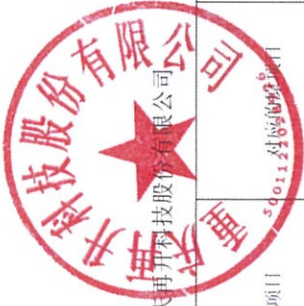
附件三：变更募集资金投资项目情况表