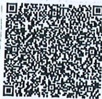
张军的年检二维码

本证书经检验合格，继续有效一年。 This certificate is valid for another year after this renewal.