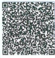
郑军的单位二维码.png