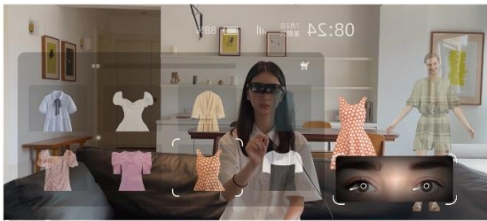
虹软智能 XR 头显眼球追踪解决方案

公司还重点实现并改善了 XR 头显手眼联合交互技术 (Hand and Gaze Fusion Interaction)，该技术融合了手势交互技术 (用户可通过手势动作来控制虚拟物体) 和眼动追踪技术 (跟踪用户视线，并根据其注视点进行相应操作)，通过分析手部、眼部的运动轨迹及其关系，实现手眼协调的交互操作，给用户提供了更自然和直观的交互方式，让用户可以通过手势和视线来操控虚拟世界。