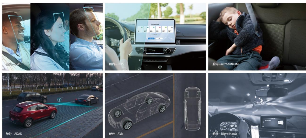
VisDrive®一站式车载视觉软件解决方案部分核心内容

报告期内，公司持续迭代 VisDrive®一站式车载视觉软件解决方案。伴随着智能座舱芯片的发展，智能座舱 SoC 芯片的 CPU、DSP、NPU、GPU 等内核算力获得大幅增强。公司将继续与高通等主流厂商合作，基于这些主流的方案平台更新迭代 VisDrive®一站式车载视觉软件解决方案，把视觉融合的自动泊车（APA）、记忆泊车（HPA）等泊车辅助功能迁移到座舱中，实现舱泊一体的完整解决方案，并进一步将智驾（ADAS）和泊车辅助功能（APA、HPA）整合为中高端芯片平台的一体化行泊视觉解决方案。