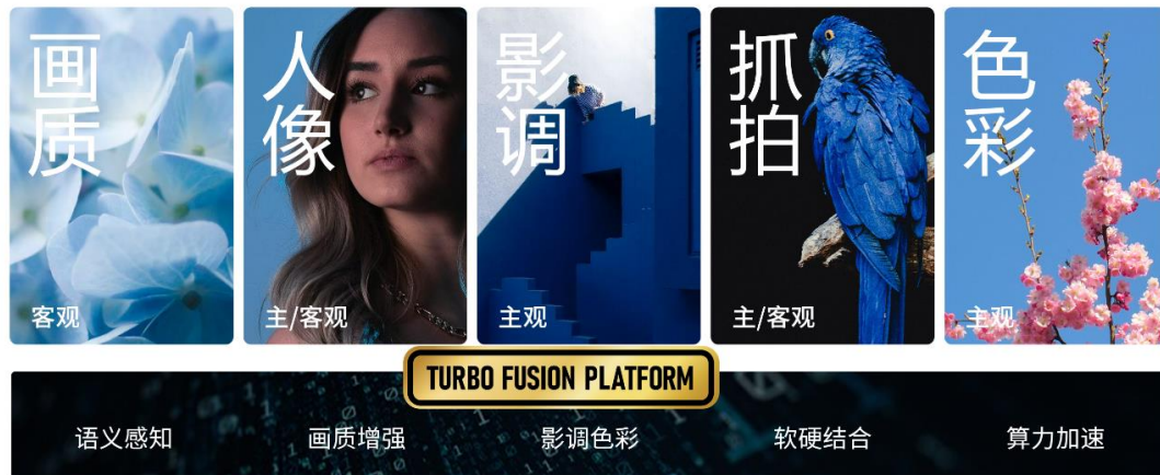
虹软 Turbo Fusion 架构