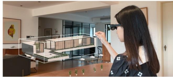
虹软智能 XR 头显手势交互解决方案