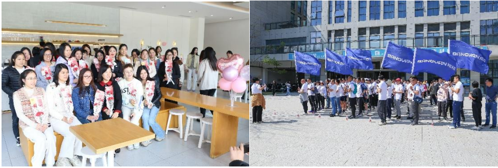
（公司部分员工活动展示）