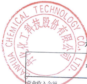
丹化化工科技股份有限公司2023年度营业收入扣除情况表