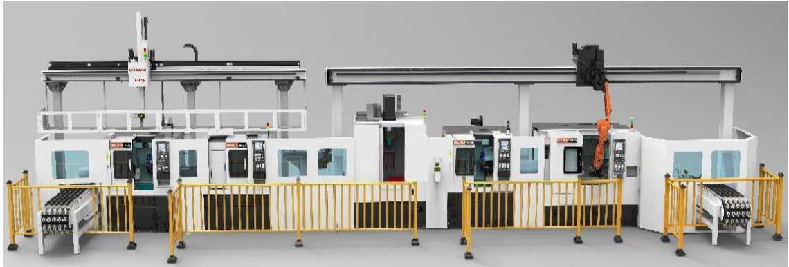
一体式自动化生产

一体式自动化生产线适用于各种轴类、盘类等零部件的高效集约化加工。可以根据客户要求配置自动检测、设备运行自动控制等功能，形成单体自动化加工单元，根据客户需求可联接多台自动化加工单元，形成一体式自动化生产线。海德曼一体式自动化生产线单体主要产品有 T35B-AUTO、T40-AUTO 和 T55-AUTO 等。部分产品图样如下：