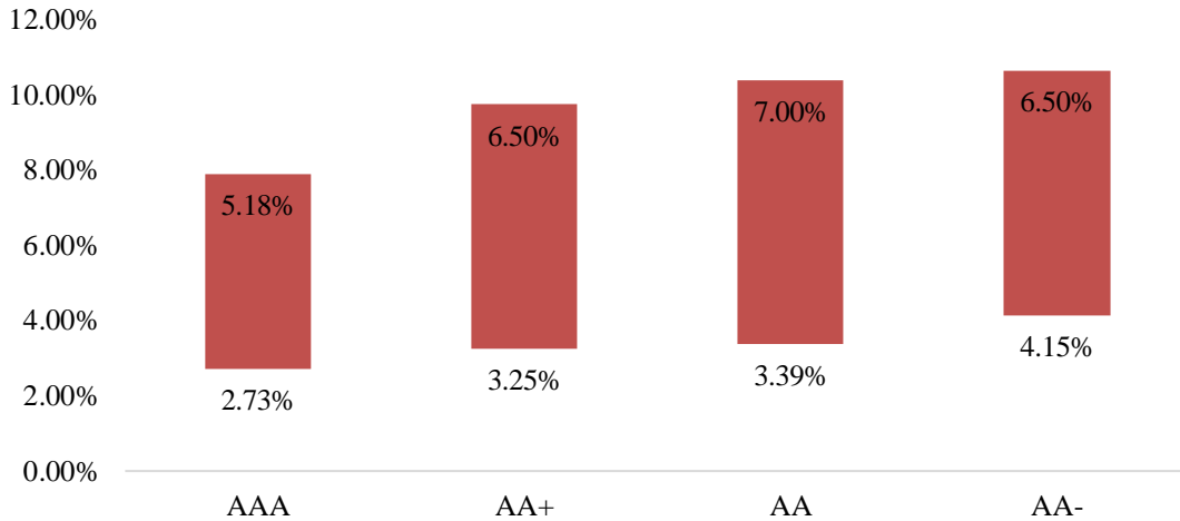
2023年1月至今不同信用评级主体企业债利率区间

(4) 向行业标杆企业看齐。公司所处行业的头部企业国药股份、国药一致在 2024 年 3 月末的资产负债率分别为 45.26%、58.43%，均低于 60%，代表了较强的风险控制能力和稳健经营能力，对公司的资本结构规划具有较强参考意义。