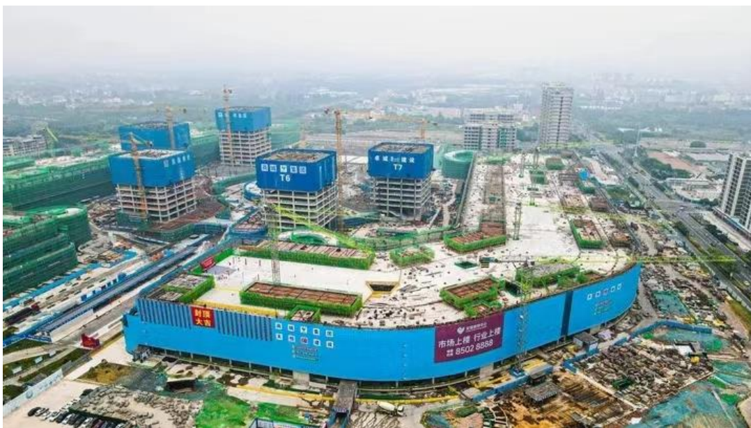
(2024 年 6 月全球数字贸易中心工程进展图)

2、全球数贸中心建设稳步推进。上半年，一期工程完成总工程量 62%，二期工程市场板块主体结项。商务写字楼板块地上主体结构完成约 68%，超高层建筑开工建设。在数字市场智能市场建设上，明确全球数贸中心网络基础建设方案；积极推进跨境网络建设，推进跨境访问产品测试；共同推进与清华面壁团队的 AI 合作项目；进一步补充完善全球数贸中心数字化方案。以公司数字化方案为基础，完善总体智慧园区建设及运营方案，以物业云平台为数字底座实现从现有单场景智能化迈向整体智能化。