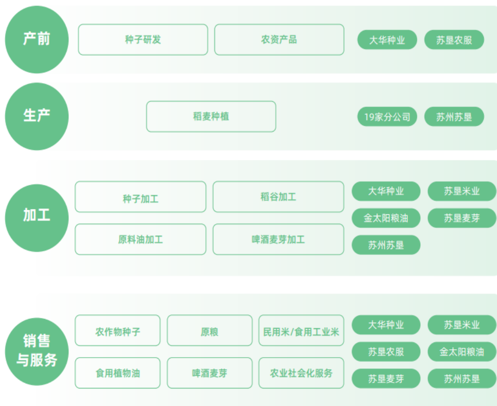
公司全产业链示意图