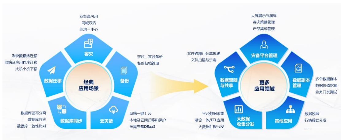
图 1 英方软件应用场景拓展

英方软件是一家专注于数据复制的软件企业，主营业务系为客户提供数据复制相关的软件、软硬件一体机及软件相关服务。公司是国内市场少数同时掌握动态文件字节级、数据库语义级和卷层块级数据复制技术的高新技术企业之一，是国家级专精特新“小巨人”企业、上海市科技小巨人企业、上海市“专精特新”中小企业，在企业业务连续性及数据复制管理领域处于领先地位。