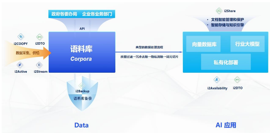
图 3 英方软件产品对人工智能应用场景分析

语料库、向量数据库、大模型和生成式 AI 等人工智能成为前沿科技的代表之一。在人工智能生成式行业共识里，数据质量决定了生成式 AI 的高度。当前，数据传输主要分为在线传输和离线传输，相对于离线传输，数据在线传输反映的数据精度更高，更能满足人工智能对日益庞大的语料库的准确性的需求。公司根据客户端对于人工智能应用的数据需求，及时响应市场关切，针对人工智能相关基础架构和数据流转方式特点，推出了从数据实时采集、迁移到语料库备份和大模型应用的灾备保护，满足客户持续发展的业务对数据和架构安全的要求。