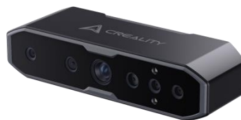
图：3D 扫描仪 CR-Scan Otter

伴随着三维扫描产业市场体量的不断增长，公司将持续探索并不断推出行业领先的三维扫描解决方案，打造极具市场竞争力的产品；同时，公司将进一步增强市场开拓力度，深耕细分行业头部客户，加速场景落地，为改善公司的经营业绩打下良好基础。