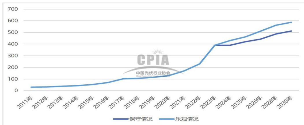
2011-2023 年全球光伏年度新增装机规模以及2024-2030 年新增规模预测 (单位: GW)