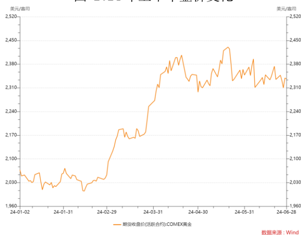
图 2024 年上半年金价变化

2024 年上半年，对于以铜为代表的战略性资源品来说，全球地缘乱局引发经贸重塑冲击供应链稳定、海外供应扰动因素大规模增多，导致供需紧平衡及风险定价重估构成本轮战略性资源品集体上涨的重要推动因素。2024 年上半年铜价由年初 8562 美元/吨上涨至 6 月底 9586 美元/吨，上涨幅度 12%，并在 5 月中下旬攀升至 11104.5 美元/吨高点。