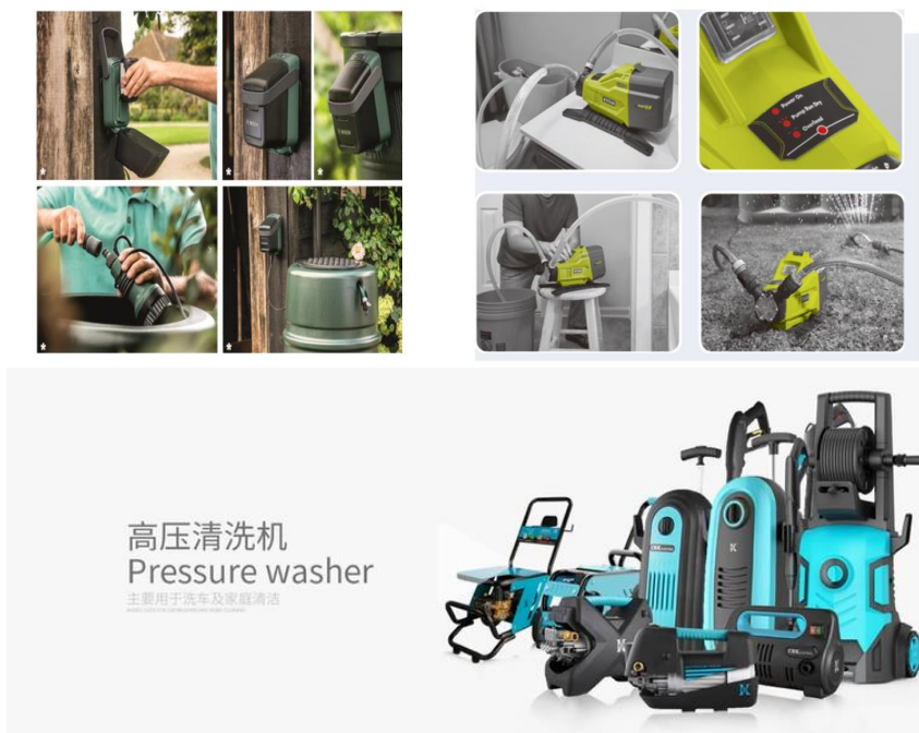
图 1 产品应用场景展示

报告期内，公司专注于家用水泵、商用水泵和清洗设备等产品的研发、生产和销售，主营业务未发生变化。