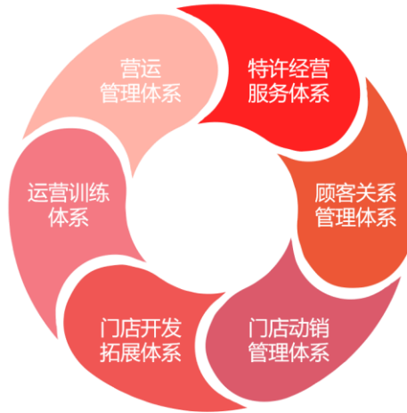
图3 公司加盟连锁渠道管控体系

公司构建了以“产品组合—单店模型—加盟体系”为核心要素的连锁加盟管理机制，通过加盟商月刊、加盟商大会、自媒体、微课堂、标杆人物评选等多种形式层层宣导，与加盟商形成命运共同体，让加盟商自发地维护品牌形象，持续成长，形成加盟商生态圈。