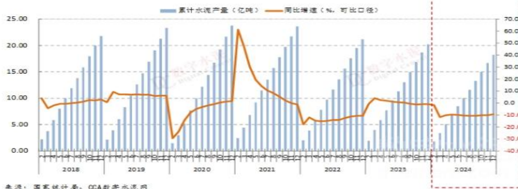
2018年以来全国月度累计水泥产量增速(%)

水泥需求持续萎缩的主因：一是房地产投资持续大幅下降，新开工项目严重不足，地产端水泥需求继续大幅下降；二是基础设施建设资金不足，公路等工程项目施工进度放缓，基建端水泥需求出现下降。