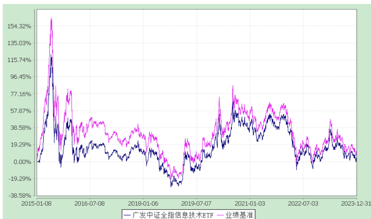
广发中证全指信息技术交易型开放式指数证券投资基金 份额累计净值增长率与业绩比较基准收益率的历史走势对比图 (2015 年 1 月 8 日至 2023 年 12 月 31 日)